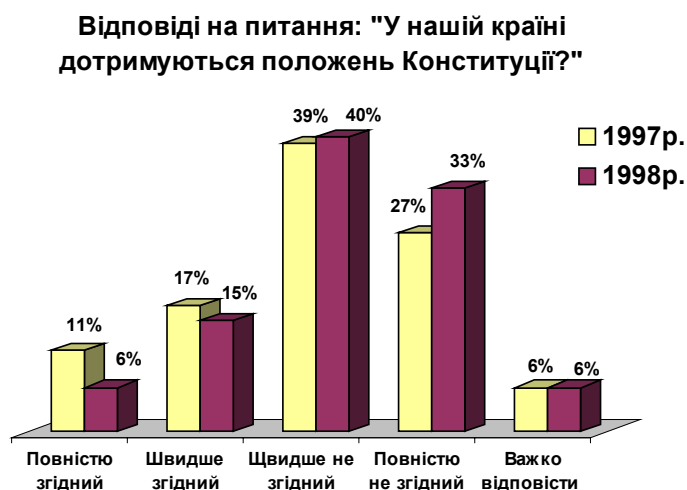
Рис.3.1.2. Думка громадян Львівщини щодо можливостей жити в державі у згоді з законом